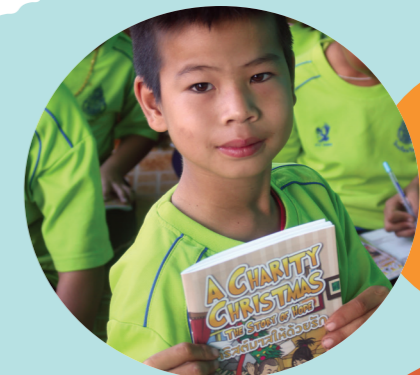
Enfant en Asie recevant son Livre de Vie, édition "spécial Noël".