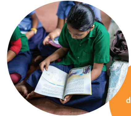
Une jeune adolescente découvre pour la 1ère fois le Livre de Vie

Le peuple japonais représente le 2ème plus grand peuple non-atteint par l'Évangile dans le monde. Les chrétiens représentent 1,2% de la population. C'est un pays démocratique garantissant la liberté religieuse mais très attaché à des traditions religieuses ancestrales et très différentes du christianisme. Le shintoïsme (84%) est la religion traditionnelle du Japon (polythéisme et sacralisation de la nature). Il imprègne profondément la sensibilité japonaise ; la figure de l'empereur lui est liée. Le bouddhisme est arrivé au VIe siècle via la Chine et s'est adapté aux réalités locales. Les chrétiens sont 2 millions sur une population de 125 millions.